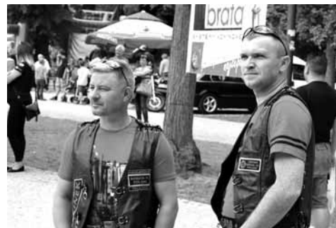
fol. P. Starzyńska, A. Sztuczka

„Motoserce” jest ideą wynikającą z potrzeby serca i z chęci działania. Celem akcji jest zwrócenie uwagi na brak tego cennego daru, jakim jest krew w polskich szpitalach oraz propagowanie idei krwiodawstwa.