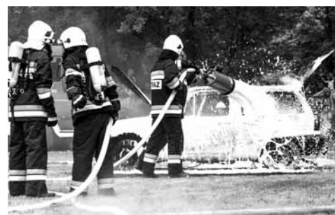
fol. S. Świątkiewicz