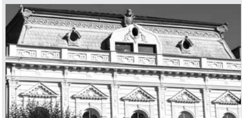
fol. W. Rosińska