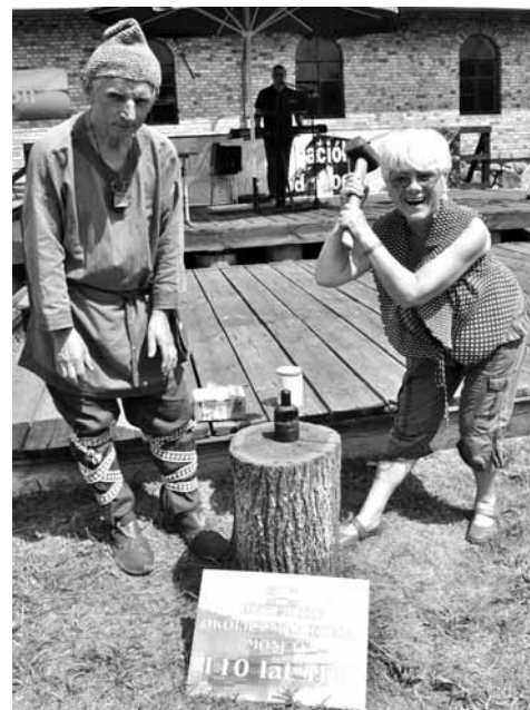
fol. J. Małecka