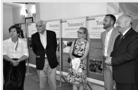
fol. S. Świątkiewicz, K. Kańkowski