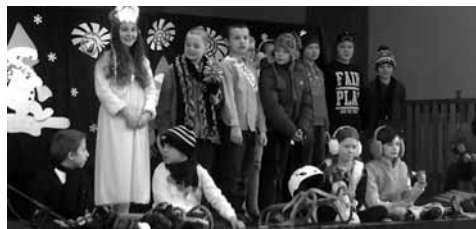
Uczniowie klasy IIIc podczas apelu na zakończenie I półrocza

W pierwszym semestrze roku szkolnego 2015/2016 dzieci z naszej podstawówki brały udział w bardzo wielu konkursach z najróżniejszych dziedzin. Dzięki własnemu zaangażowaniu i ciężkiej pracy nauczycieli zajmowali wysokie miejsca w zmaganiach o charakterze miejskim, powiatowym i ogólnopolskim.