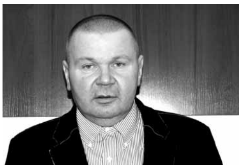
fol. J. Małeckia

- Dysponujemy nowoczesną bazą zabiegową skomunikowaną z częścią