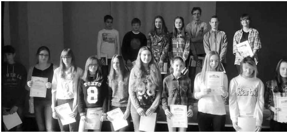
Na zdjęciu: prymusi szkoły

Niedawno rozpoczął się rok szkolny 2015/2016, a już podsumowujemy jego pierwsze półrocze. Jakie było dla ciechocińskich gimnazjalistów? W związku z tym, że trwało bardzo krótko, to nauka była intensywna, ale i efektywna. Uczniowie rozwijali swoje zainteresowania i doskonalili zdobyte umiejętności na lekcjach oraz na licznych kołach zainteresowań, których programy uwzględniają także pasje uczniów. Szeroka paleta kół zainteresowań zaowocowała udziałem uczniów w licznych konkursach i olimpiadach. Poniżej prezentujemy listę uczestników i laureatów poszczególnych konkursów.