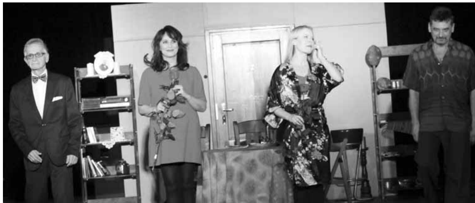
Finał spektaklu „Wszystko przez Judasza”.