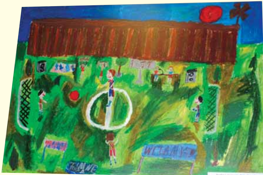
Nagroda Grand Prix.