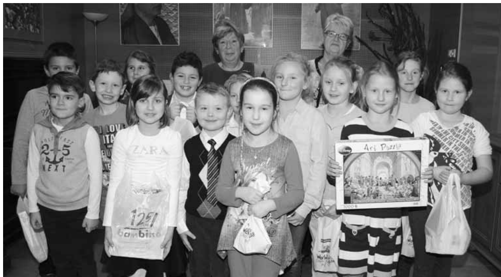
30.10.2015 r. - Uczestnicy konkursu „Kocham zwierzęta” wraz z organizatorkami.