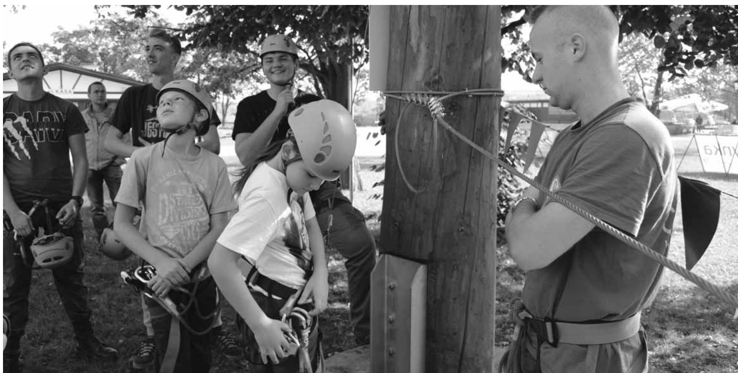
Ogromną popularnością wśród dzieci i młodzieży cieszył się park linowy.