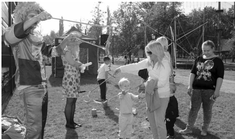
Animatory wypełniali czas maluchom, a do wspólnej zabawy włączali się również rodzice.

W październiku br. Urząd Miejski w Ciechocinku wraz z Urzędem Marszałkowskim Województwa Kujawsko-Pomorskiego oficjalnie zakończył realizację projektu unijnego „Odnowa funkcji publicznych zdegradowanych terenów uzdrowiskowych w Ciechocinku”, organizując dla mieszkańców oraz gości naszego miasta sportowe oraz muzyczne święto.