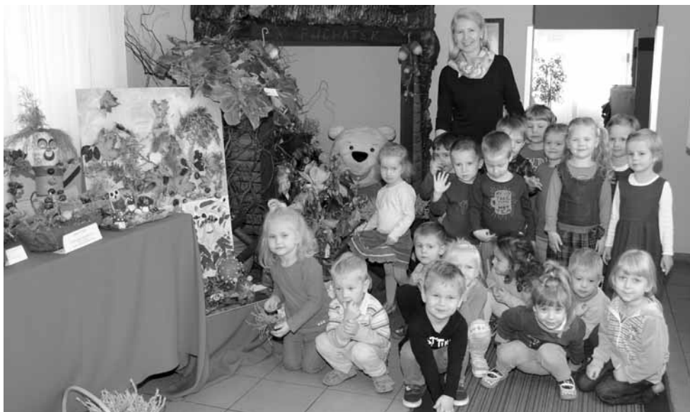
fol. K. Jasińska

Stało się tradycją, że na początku października w Przedszkolu Samorządowym nr 2 im. „Kubusia Puchatka” w Ciechocinku odbywa się przegląd twórczości artystycznej dzieci i rodziców „Dary jesieni”.