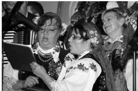
Zespół Pieśni i Tańca „Wiśniowa Góra”.

Na zaproszenie Związku Ochotniczych Straży Pożarnych RP i burmistrza Ciechocinka 11 października br. w Teatrze Letnim w Ciechocinku odbyły się XIX Regionalne Spotkania Zespołów Artystycznych Ochotniczych Straży Pożarnych. Wydarzenie połączono z obchodami XV Dnia Papieskiego.