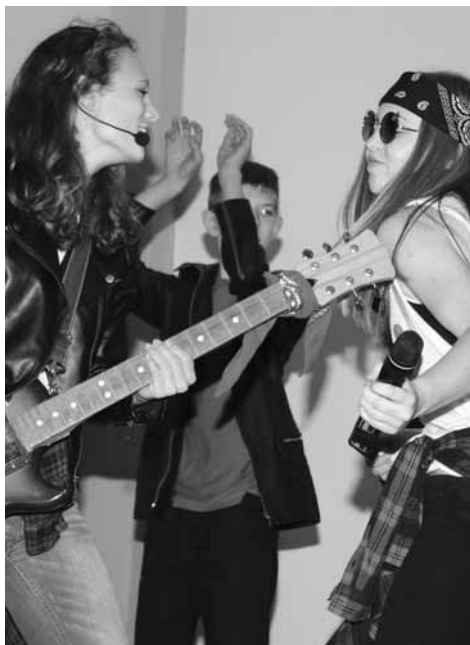
Występ młodzieży podczas konkursu „Twoja twarz brzmi znajomo”.

możliwości i umiejętności uczniów klas pierwszych, zakończyły się pomyślnie, przyszła kolej na oficjalną część otrę-