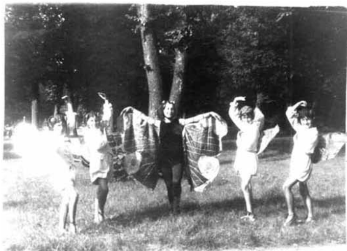
Taniec motylków - fragmenty przedstawienia z 1933 r.