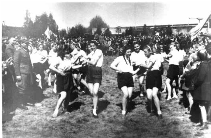
Taniec - fragment popisu uczniowskiego z 1947 r.

• Szkoła zaś państwowa, utrzymywana z fundusów skarbowych, podatku szkolnego od właścicieli