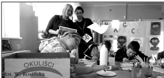
Akcja „Okuliści dla Afryki” w SP nr 1 w Ciechocinku