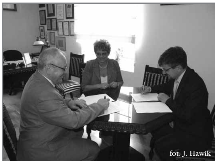
fol. J. Hawik

Ciechocinek po raz drugi w historii miasta wyemitował obligacje komunalne, których celem było pozyskanie kapitału na realizację inwestycji infrastrukturalnych.