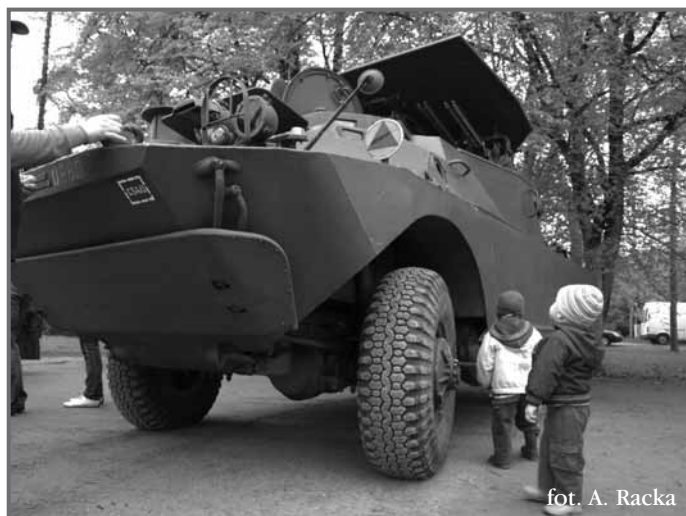
fol. A. Racka