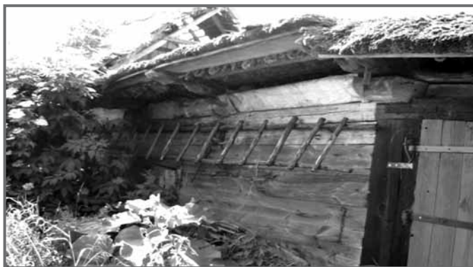
Zagroda olęderska, Słońsk Górny nr 20