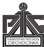
Towarzystwo Przyjaciół Ciechocinka