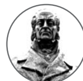
Liceum Ogólnokształcące im. Stanisława Staszica w Ciechocinku