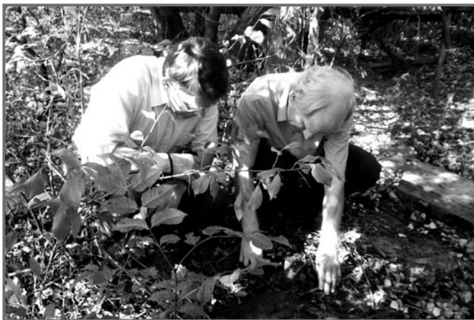
Miejsce po cmentarzu ewangelickim w Nieszawie.