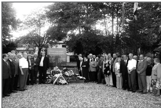
Uczestnicy konferencji przy pomniku - symbolu pojednania między Polakami a Niemcami.

Podczas konferencji zostało podjętych wiele tematów, w tym bardzo drażliwych, dotyczących II wojny światowej, zarówno przez referentów, jak i świadków.