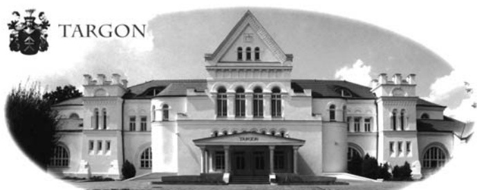
PALAC ZDROWIA, ODNOWY BIOLOGICZNEJ I URODY

Zaprasza do swoich apartamentów, restauracji i drinkbaru.